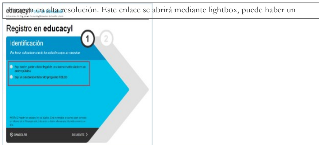
Imagen en alta resolución. Este enlace se abrirá mediante lightbox, puede haber un